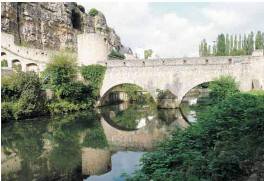
Luxemburg, Brücke bei den Kasematten