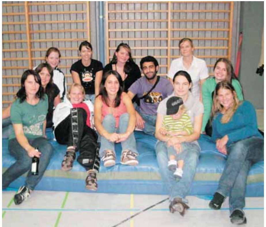
Das Team nach dem Freundschaftsspiel gegen den TV St. Ingbert

Auch innerhalb der Mannschaft gibt es einige Veränderungen. Fünf neue Spielerinnen verstärken das Team auf allen Positionen. Aus beruflichen oder familiären Gründen sowie verletzungsbedingt stehen jedoch ei-