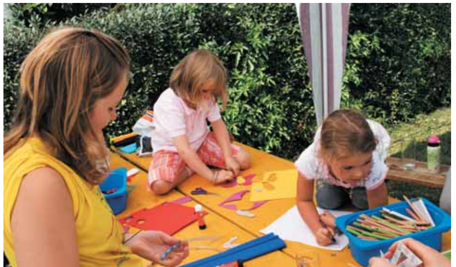
Mit Feuereifer bei der Bastelarbeit

Auch der Jugendausschuss war am Sonntag mit vielen Helfern vertreten. Neben dem traditionellen Waffelstand, der auch in diesem Jahr viel Anklang fand, war der Jugendausschuss auch für das Kinderprogramm zuständig: Am Bastelstand konnten die Kinder unter der Anleitung der Jugendausschussmitglieder bunte Armbänder aus Gummischlauch und