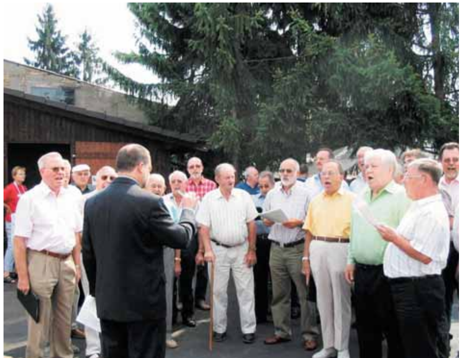
Traditionell dabei: die Singgemeinschaft Hechtsheim

Ausgewählte Lieder erklangen durch die Sänger der Singgemeinschaft Hechtsheim zum Fröhschoppen. Der bewährte Kinderflohmarkt bot reichhaltige Auswahl von Spielzeug und mehr. Eine Hüpfburg und verschiedene Geschicklichkeitsspiele, organisiert durch den Jugendausschuss des Vereins, boten Spiel und Spaß für die jüngeren Besucher.