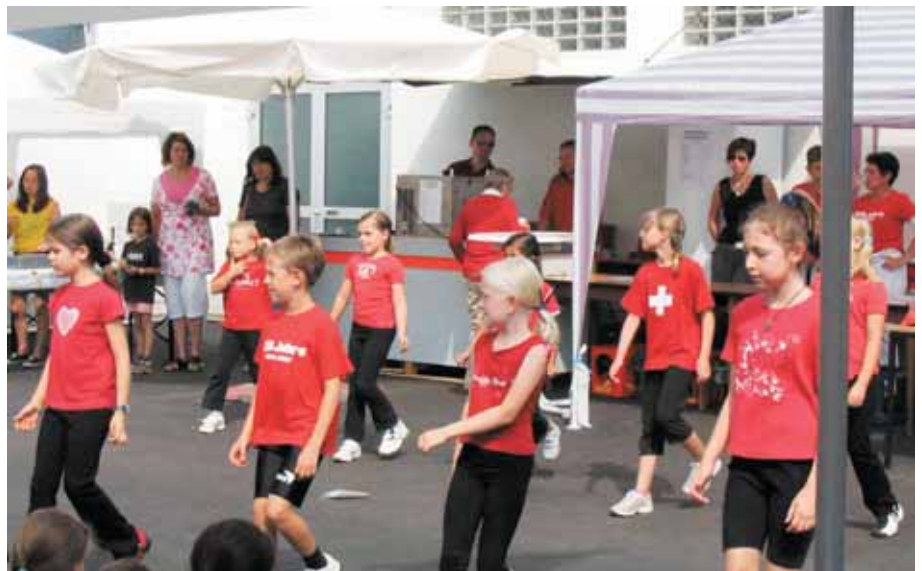
Der jüngste TV-Tanz-Nachwuchs in Aktion