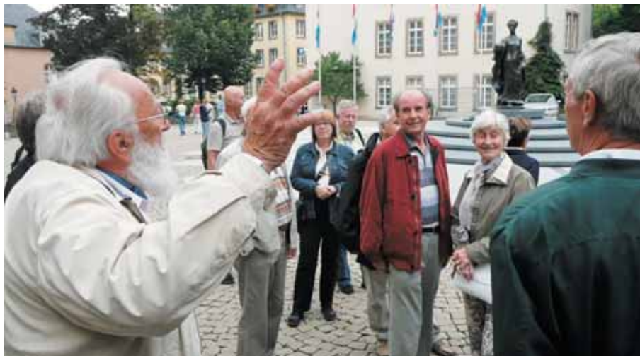
Stadtführer und TVler vor dem Denkmal der Großherzogin Charlotte

die Altstadt erklärte. Danach ging es weiter nach Luxemburg, wo wir im „Best Western Hotel“ in der Stadt unser Quartier bezogen.