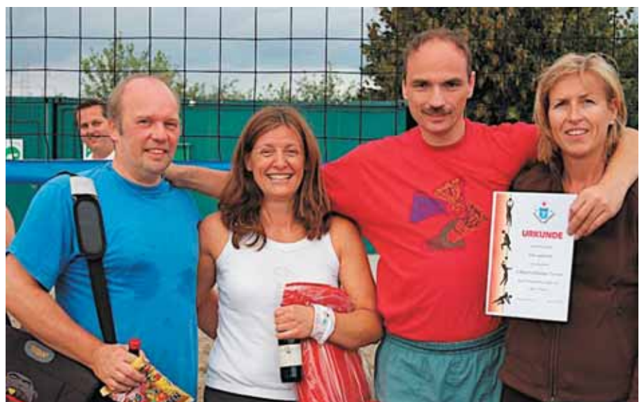
Turniersieger 2008: Vier gewinnt

Turniersieger des zweiten Beachvolleyball-Turniers am 23. August 2008 wurde die Mannschaft „Vier gewinnt“. Eine Mannschaft, die aus seit ca. 10 Jahren „pensionierten“ Volleyballern der Hechtsheimer Damen- und Herrenmannschaft bestand. Sie setzten sich im großen Finale gegen die Freizeitgruppe des TV Hechtsheim, die „Sandfetschisten“ durch. In einem packenden Finale über zwei Gewinnsätze musste der Tie-Break die Entscheidung bringen. Dritter wurde der Vorjahressieger aus Bingen „Die Sandflöhe“. Die Ver-