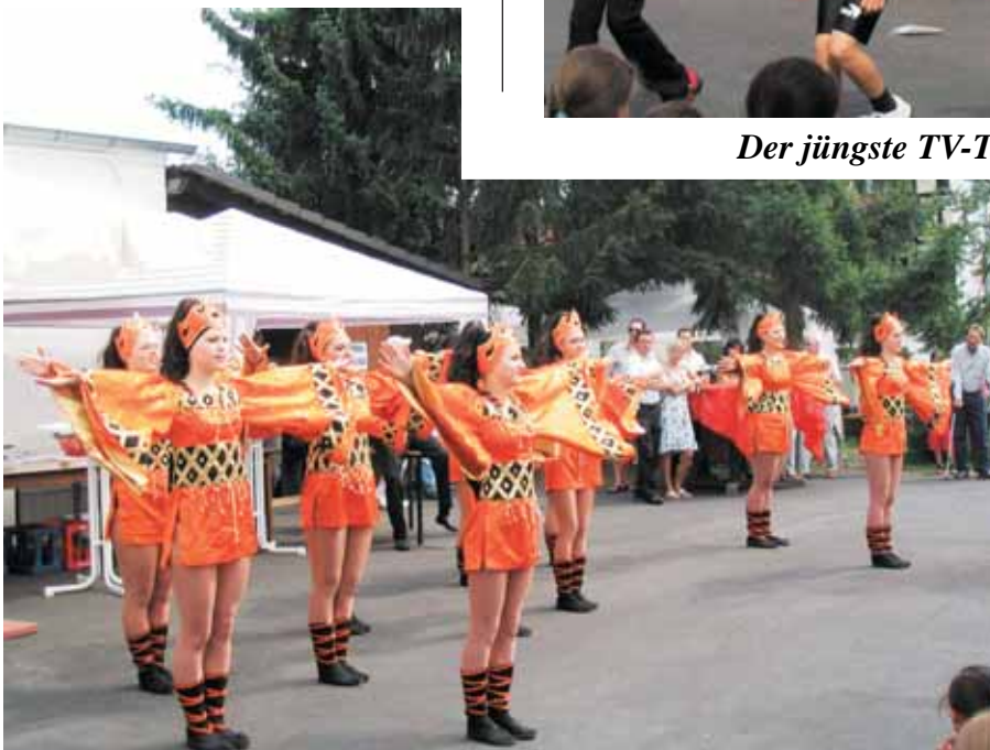
Die „Fun und Dance Girls“ mit beeindruckendem Auftritt