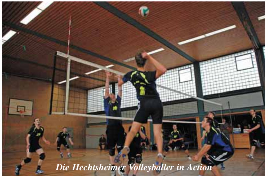
Die Hechtsheimer Volleyballer in Action

Eine erste Standortbestimmung bei einem Vorbereitungsturnier Ende August fiel noch nicht so ganz zufriedenstellend aus und es wird nicht ganz einfach sein, sich bei den durchweg stärkeren Gegnern so durchzusetzen, dass der Klassenerhalt zu sichern ist. In diesem Jahr kann denn auch nur der erfolgreiche Verbleib in der Rheinhessenliga das Ziel von Spielern und Trainer sein.