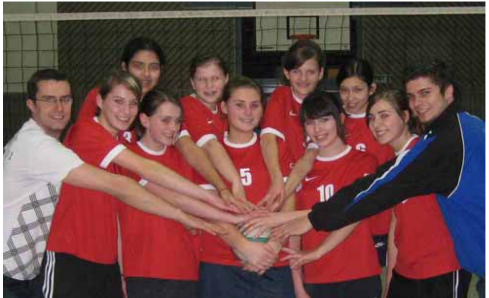
Volleyball; 2. Damen- und Jugendteam

Mädels im Alter von 14 bis 16 Jahren werden nämlich zusätzlich auch die Damenliga austesten, um neben der Bewegung und dem Spaß am Spiel natürlich auch mehr Erfahrung zu sammeln. Dafür haben wir eine Mannschaft mit den erfahrenen Spielerinnen zusammengestellt, die nun auch ihre eigene Trainingszeit hat. Geschwitzt wird jede Woche montags (18.00 bis 19.30 Uhr alte Schulturnhalle) und dienstags (18.30 bis 20.00 Uhr neue Schulsporthalle) um neben den Grundtechniken auch die höheren Künste des Volleyballs zu erlernen. Wem das aber zu viel ist und einfach mal in den tollen Sport reinschnuppern will kann das natürlich auch gerne in unseren Anfängertrainingszeiten tun. Die Mädels ab Jahrgang 96/97 trainieren zusammen montags von 17.00 bis 18.00 Uhr (alte Schulturnhalle) und donnerstags von 17.00 bis 18.30 Uhr (neue Schulsporthalle). Aber auch für unsere Kleinsten (MIX) haben wir natürlich Zeit (dienstags 17.00 bis 18.30 Uhr neue Schulsporthalle). Und wenn sich die Jungen mal nicht für Fuß-