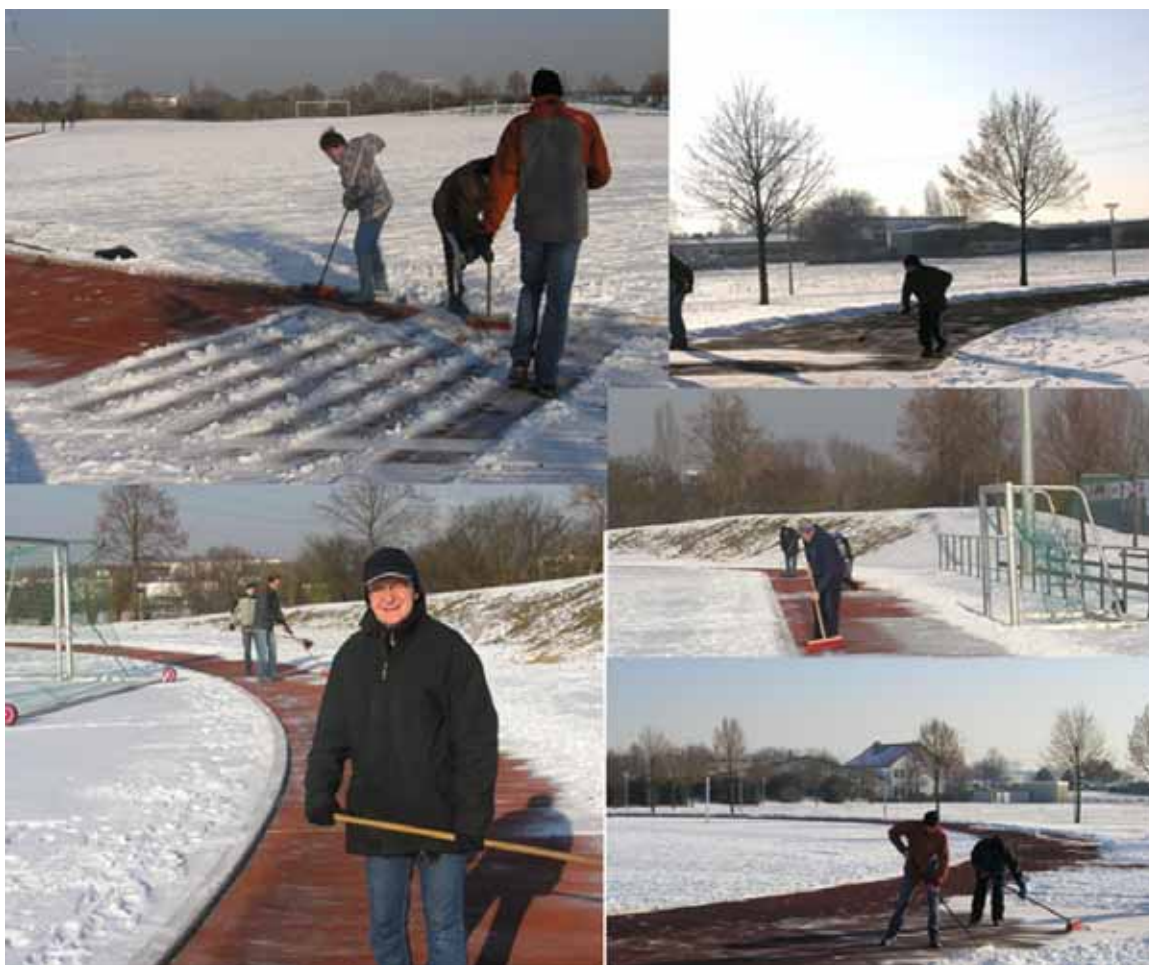
Zusätzliches Training durch besonderen Einsatz

Der Winter wollte einfach nicht enden. Abgesehen von den Minustemperaturen war die Lauf-