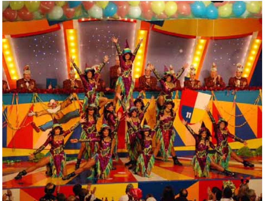
Bühnenbild bei den Mombacher Bohnebeitel mit „Fun & Dance“

Die Höhepunkte in dieser Kampagne waren - wie auch im Jahr zuvor - wieder die zehn Auftritte bei den „Mombacher Bohnebeitel“ und damit verbunden die Fernsehaufzeichnung im dritten Programm des SWR. Passend zu unserem Einmarschlied „Mitter-