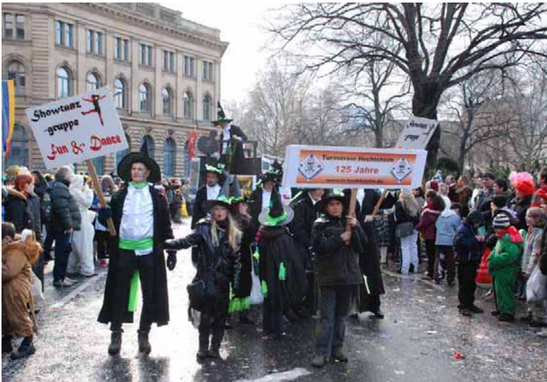
Treue Fans von „Fun & Dance“

einfach zu erklären: Mit diesem Tanz hatten sich die Mädchen bei den Mombacher Bohnebeiteln am Worschtowend am 11.11.2008 vorgestellt. Wir wollten uns mit eindrucksvollen Kostümen bei den Bohnebeiteln präsentieren und dies ist uns mit den schönen Chinesenkleidern auch gelungen. Zudem konnten die Mädchen Auftritte von Fun & Dance übernehmen, u. a. beim Lerchenberger Carneval Club und Akkordeon Fortsetzung Seite 16