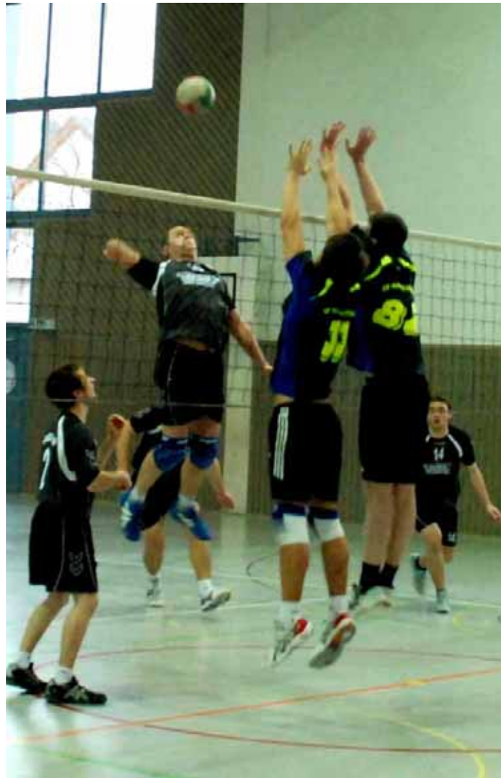
1. Volleyballmannschaft in Spielaktion

Die aktuelle Tabelle spiegelt nicht das mögliche Leistungsniveau der Mannschaft wider, aber man kann auch nicht zufrieden sein mit den bisher in dieser Saison erzielten Ergebnissen. Es sind nur wenige gegnerische Mannschaften, die sich im Hinblick auf das technische Potenzial der einzelnen Spieler entscheidend von den TV-Volleyballern abheben. Vielmehr fehlt es an der mannschaftlichen Geschlossenheit und nicht zuletzt am nötigen Selbstvertrauen, so dass leider regelmäßig die Freude am Spiel verloren geht und die Moral in den Keller