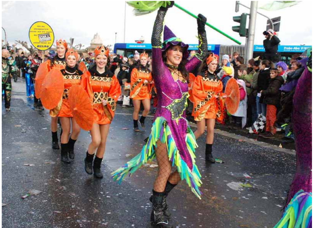
Chinesinnen: TV-Ballett „Fun & Dance Girls“