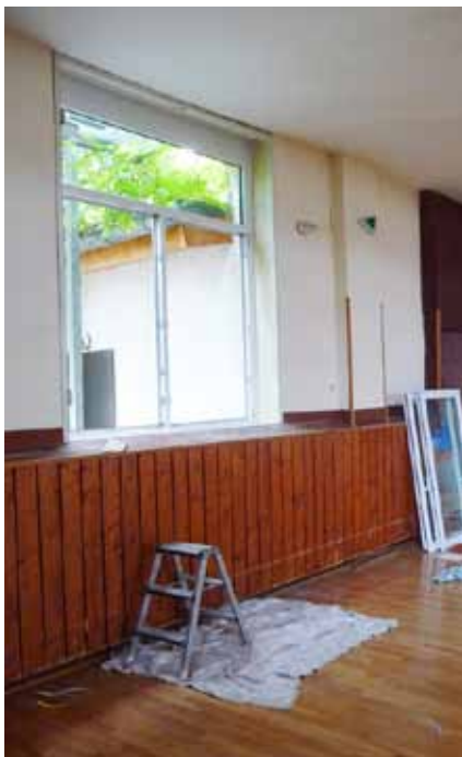
Einsetzen des neuen Fensters

im Bühnenraum der Ausbau der Glasbausteine mit anschließendem Fenstereinbau.