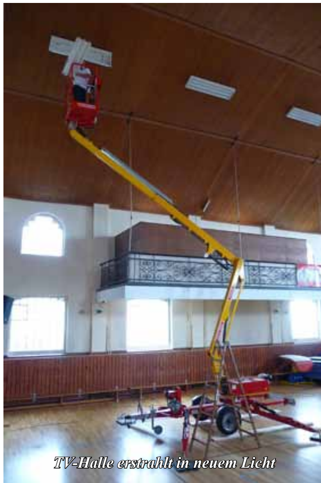
TV-Halle erstrahlt in neuem Licht

Als erste Baumaßnahme erfolgte zu Beginn der Herbstferien der Austausch der Leuchtstoffröhren der Hallen- und Bühnenbeleuchtung gegen LED-Röhren. Dazu musste vom TV eine fahrbare Arbeitsbühne („Anhängergelenkteleskopbühne“)